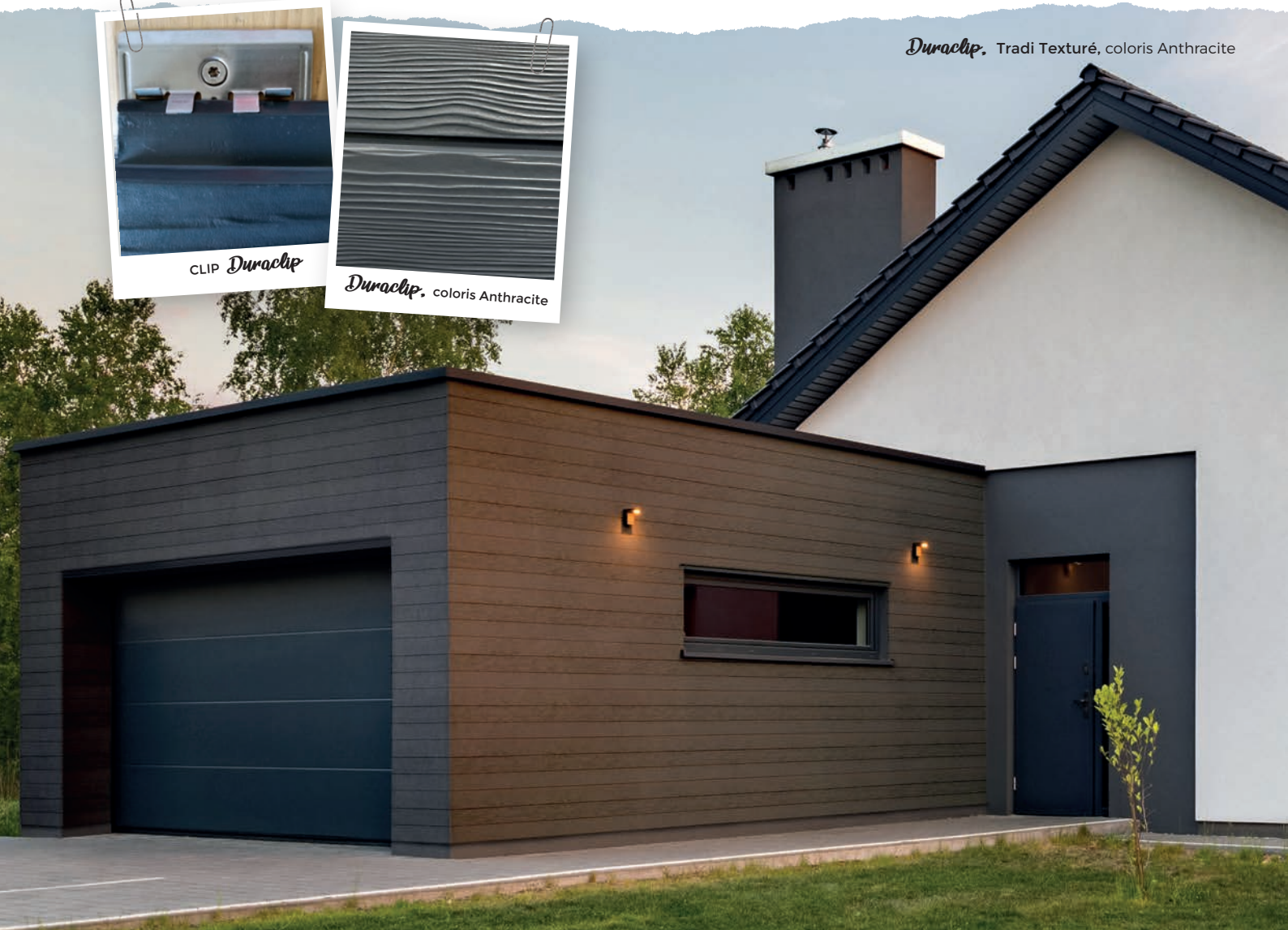
Duraclip , Tradi Texturé, coloris Anthracite