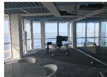
SNEF - Marseille

Visuels en haute définition disponibles sur demande