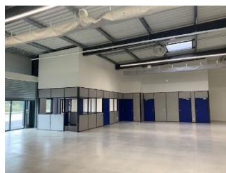
REXEL - Orange