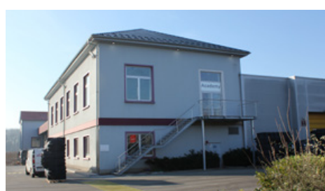
GRAF (67) - Batiment H6 - 2023