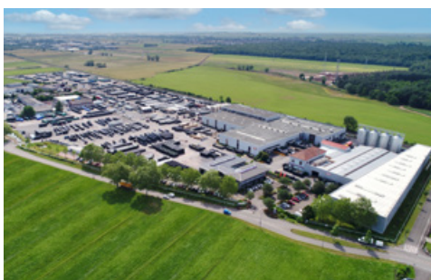
GRAF - Site de Dachstein - 2021