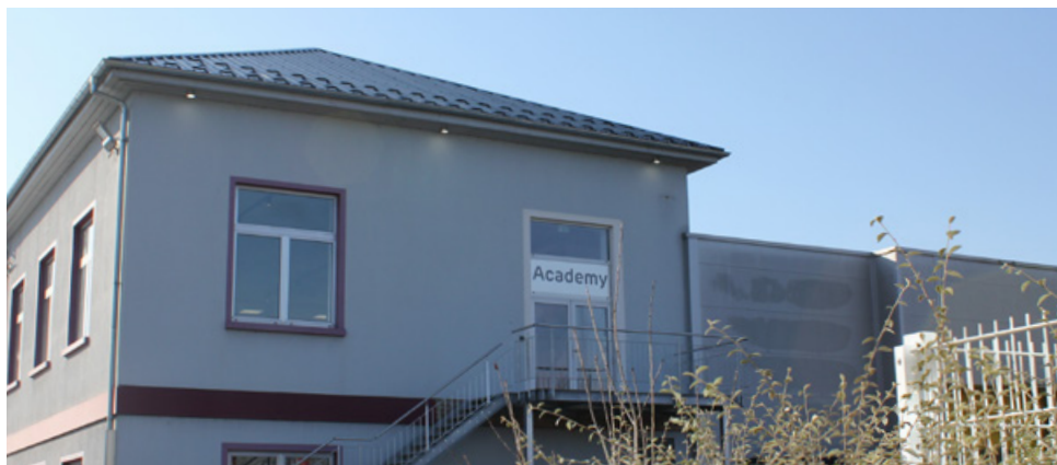
GRAF Academy - 2023

GRAF France, leader européen sur le marché de la gestion des eaux pluviales, lance son tout nouvel espace de formation de 500 m 2 à partir de début février.