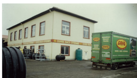
GRAF (67) - Batiment H6 - 1981

Pour cela, plusieurs ateliers sont proposés : une partie théorique au showroom, une mise en pratique dans l'atelier et une visite d'usine.