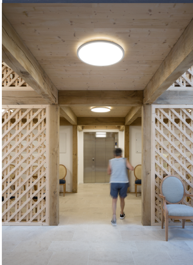
En haut : Pop Acte, lauréat 2022 dans la catégorie Logement collectif / En bas : Maison de santé de Liffolle-Grand, lauréat 2022 dans la catégorie Bâtiment public ou tertiaire