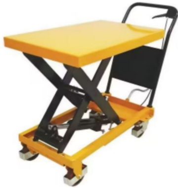
TABLE ÉLÉVATRICE 300 KG

Cette table élévatrice peut lever des charges entre 330 et 910 mm et elle peut supporter jusqu'à 300 kg. Cet appareil polyvalent est équipé d'un plateau 830*500 mm, de ciseaux simples et de roues 160 mm.