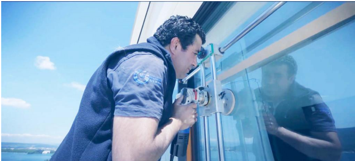
WonderGlass by Vetrox

Jusqu'à présent, lorsqu'un vitrage était rayé ou dégradé, la seule solution était de remplacer le verre.