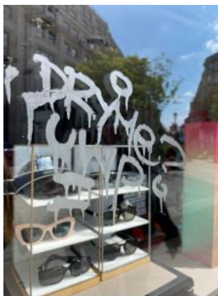
Tag à l'acide sur vitrine