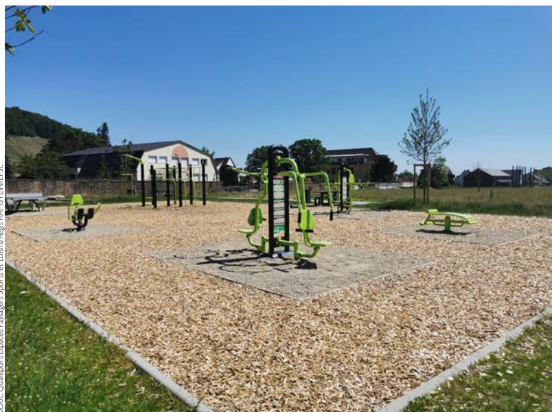
► Espace de fitness extérieur d'Andlau dans le Bas-Rhin

Pour les candidats, la démarche est volontaire mais stricte, la qualification Qualisport, étant basée sur le respect d'exigences administratives, juridiques, financières, matérielles et techniques définies par l'Organisme. Pour l'entreprise, si qualification(s) obtenue(s), le certificat de qualification délivré par Qualisport atteste de sa compétence pour réaliser une prestation donnée. Pour les donneurs d'ordres, dans le cadre d'une décision d'attribution d'un marché, la qualification permet de se rassurer sur les moyens (effectifs, expérience, matériels, etc.) ou les garanties professionnelles (assurances, etc.) de son prestataire. Précisons que l'acheteur dispose de cette possibilité, en application de l'arrêté du 22 mars 2019 fixant la liste des renseignements et des documents pouvant être demandés aux candidats aux marchés publics.