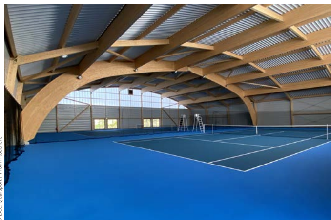
► Cours de tennis couvert d'Auneau-Bleury-Saint-Symphorien (Eure-et-Loire)