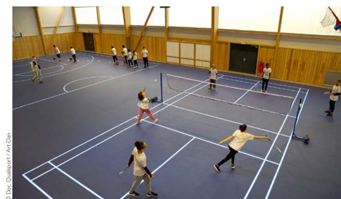
► Gymnase Daniel Royer à Châlons-en-Champagne