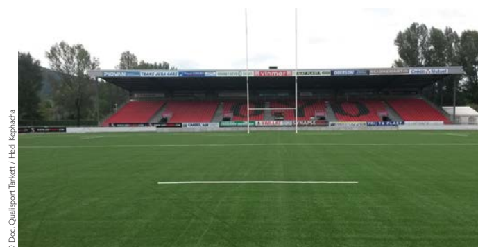
► Le stade de rugby d'Oyonnax équipé du gazon synthétique Tarkett