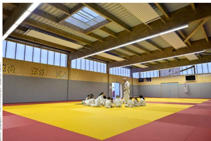
► Gymnase des Ewues

Depuis 2020, Qualisport constitue une bibliothèque documentaire disponible sur son site internet, relative à la construction et la maintenance d'infrastructures sportives qui propose de nombreuses fiches réalisées avec l'aide d'entreprises spécialistes qualifiées. Ces fiches (Agrès de Gymnastique, Sol Equestre, Sports de sable, Padel, Skateparks modulaires et Terrains multisports...) permettent de distiller les meilleurs conseils aux donneurs d'ordres et responsables de collectivité en recherche d'informations pour construire ou rénover des équipements sportifs.