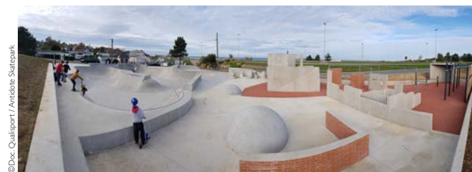
► Le skatepark de la Saline à Cherbourg

Qualisport est partenaire de longue date de l'UNSA (Union des Architectes), de l'AITF (association des ingénieurs territoriaux de France), de l'ANDIIS (réseau national des Directeurs et Intervenants d'Installations et Services des Sports), ou encore, depuis peu, de la SMABTP et de l'Agence Qualité Construction (AQC).