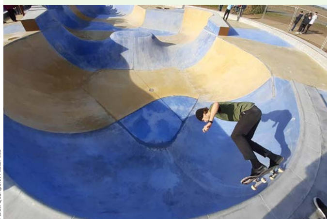
► Le skatepark d'Aiguillon la Presqu'île