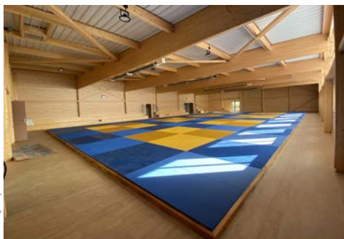
► Complexe omnisports de Auneau-Bleury- St-Symphorien (Eure-et-Loire)