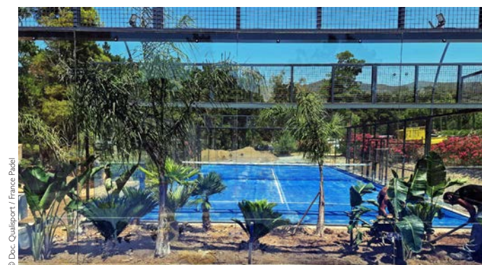
► Tennis de Belambra, Golfe de Lozari, Corse