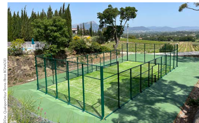
► Padel du Domaine de la Navicelle au Pradet