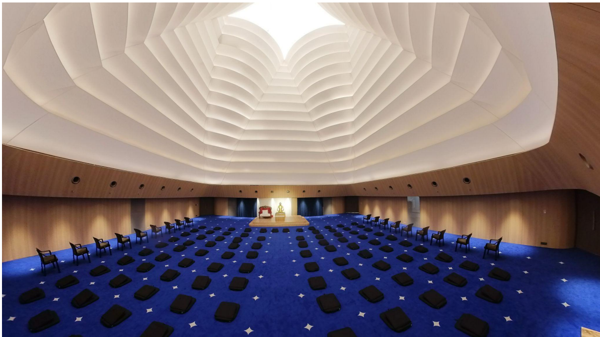
Salle de méditation, Shrimad Rajchandra Ashram.

Niché sur une colline, aux abords de la ville de Dharampur en Inde, ce siège international, et centre spirituel, de Shrimad Rajchandra Mission Dharampur, incarne une oasis dédiée à la foi et à l'élévation spirituelle. Serge Ferrari Group s'inscrit dans l'architecture de ce bâtiment singulier, en habillant la salle de méditation, de sa toile Alphalia Silent AW. Une solution acoustique qui respecte l'harmonie et l'atmosphère intemporelle du lieu.