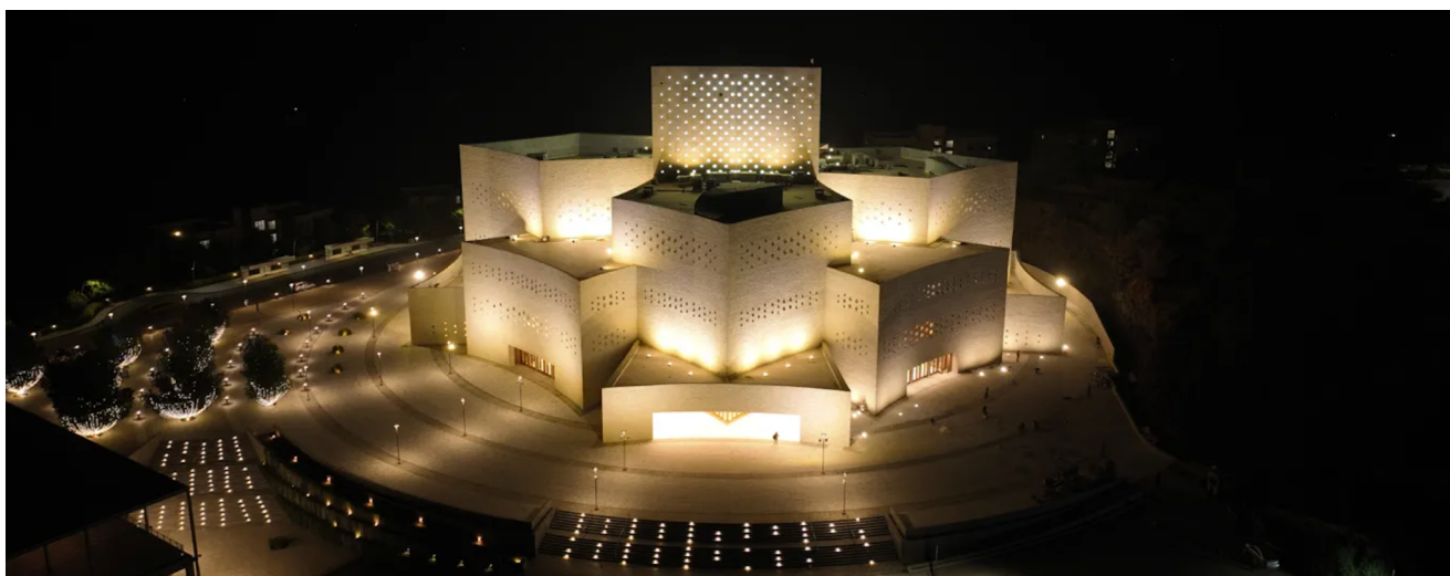
Centre Raj Sabhagruh, avec à l'intérieur, la salle de méditation.

L'objectif des architectes était à la fois d'assurer calme et confort en minimisant autant que possible les réverbérations sonores pouvant perturber la tranquillité des occupants, tout en laissant passer la lumière naturelle. Pari réussi grâce à la toile Alphaia Silent AW, d'un blanc translucide. La lumière pénètre dans le lieu, et se diffuse de manière douce et uniforme à l'intérieur. Sa solidité et sa flexibilité a de plus permis aux architectes de l'adapter à l'architecture - en lanterne - du bâtiment.