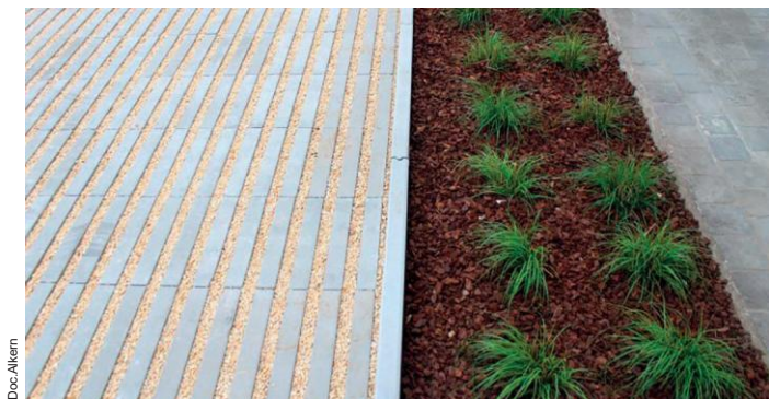
La dalle drainante Linogreen

Dalle drainante déclinée en modules de 40 x 30 x 10 cm, Linogreen combine hautes performances techniques et esthétique contemporaine. Grâce à son design épuré à barrettes visibles, LinoGreen permet aux aménageurs urbains de composer des allées, parkings ou espaces publics alliant gestion efficace des eaux pluviales (Classe d'appellation : D1-D2-D3R-D4R au sens du référentiel de certification NF187) et qualité visuelle. Avec un taux d'ouverture de 20,7 %, elle autorise un remplissage souple (gravillons ou végétation) selon usage et ambition paysagère. Elle offre ainsi aux aménageurs une solution responsable et décorative pour adapter les espaces extérieurs aux défis du climat.