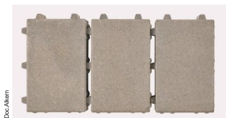
Le pavé Hydrojoint dans son nouveau format de 20 x 30 cm.

Mentionnons qu'Alkern densifie encore sa Gamme O' de réponses de pavés drainants avec l'arrivée d'un nouveau format pour l'Hydrojoint à écarteurs de 15 mm, désormais proposé en format de 20 x 30 cm. Une nouvelle référence qui, par sa souplesse décorative permet de créer des aménagements extérieurs durables et harmonieux.