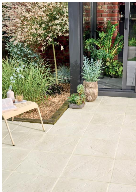
La dalle Rustique Re-source en coloris Sable.

Ainsi, Alkern annonce la disponibilité de sa dalle sur plots Re-Source, désormais produite à base de granulats de béton recyclés (GBR). Une référence qui réduit de facto l'impact carbone tout en favorisant l'économie circulaire. Dans la même logique, Alkern confirme l'arrivée d'un coloris sable de sa dalle Rustique Re-Source, référence emblématique de sa collection ; une teinte naturelle et chaleureuse qui complète idéalement une palette déjà très appréciée des concepteurs et paysagistes.