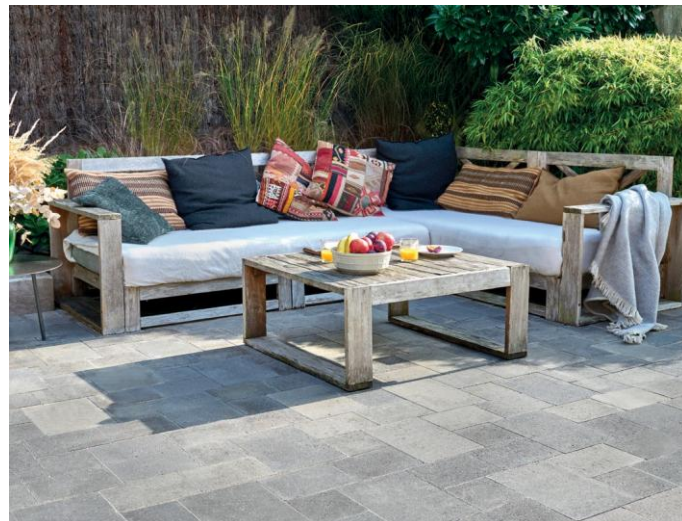
Pavés Newhedge classique multiformat coloris Grey.

À découvrir donc sur le stand Alkern à Paysalia 2025 : des produits drainants (Newhedge drainant, Linogreen et Hydrojoint) mais aussi des références bas carbone (pavé Hydrojoint Océan...)