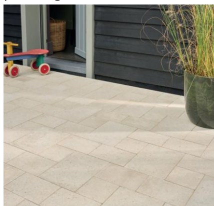
Le coloris Ivory du pavé Newhedge multiformat classique.

Soulignons qu'Alkern propose aussi une version multiformat du Newhedge dans sa forme classique disponible en trois coloris (Ivory, Grey et Coal) et disponible exclusivement sur la région Nord. Les atouts de cette nouvelle réponse Alkern résident dans leur modularité assurant une grande liberté de composition. En variant les dimensions sur un même aménagement, ils autorisent une grande flexibilité de pose pour le plus grand plaisir créatif des concepteurs, paysagistes et donneurs d'ordre des collectivités . Leur aspect visuel, évoquant des compositions plus naturelles et contemporaines, gagne ainsi en rythme comme en authenticité. Cassant la monotonie visuelle, ces solutions multiformats permettent enfin d'obtenir des alignements plus élégants.