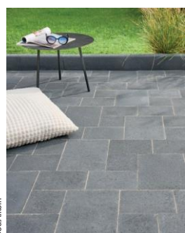
Pavé Newhedge classique multiformat coloris Coal.

Avec toujours cette version drainante de son pavé iconique, Alkern renforce encore ses réponses en vue de faciliter l'absorption rapide et efficace des eaux pluviales par infiltration dans le sol . Ces références, à la surface antidérapante sécurisant les déplacements et ne nécessitant que peu d'entretien, empêchent en effet la formation de flaques d'eau et réduisent fortement ruissellements et risques d'inondation. Précisons qu'Alkern a pourvu Newhedge drainant d'écarteurs de 5 mm facilitant la pose et conçus afin d'assurer l'infiltration des eaux pluviales avec un remplissage des joints en gravillons 1/3 mm ou 2/4 mm concassés et dépourvus de fines (lit de pose et un fond de forme drainants). Par ailleurs, ils revendiquent une durabilité élevée grâce à un hydrofuge de masse intégré dans leur process de fabrication.