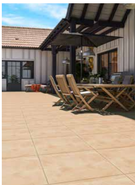
La dalle Coliséa, à l'aspect travertin authentique et aux dimensions grand format (60x60 cm) au prix public indicatif de 51,19 euros HT/m 2

www.alkern.fr/catalogues-amenagement-exterieur