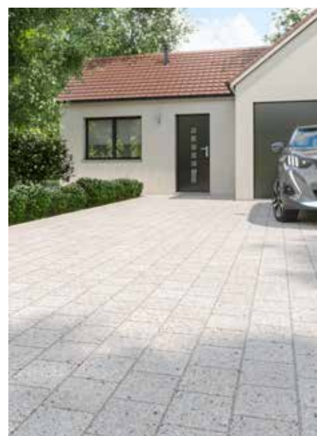
Les pavés Océan, (24x24 cm) qui ont la particularité d'un aspect de surface constitué en partie de déchets de coquilles Saint-Jacques broyées au prix public indicatif de 38,92 euros HT/m 2

Le groupe Alkern est un des leaders français de la préfabrication d'éléments en béton permettant des modes constructifs peu carbonés pour le bâtiment, offrant des solutions d'aménagement durable des villes, ayant la capacité d'infiltrer les eaux de surface et proposant des produits d'embellissement des espaces extérieurs (jardins, piscines, voirie). En apportant des réponses concrètes au regard des enjeux majeurs du réchauffement climatique et de ses effets, le Groupe Alkern propose ainsi des solutions durables à l'aménagement des territoires, aux besoins d'un habitat sain, confortable, esthétique, respectueux de l'environnement et patrimonial. Avec plus de 250 millions de chiffre d'affaires en 2022 et plus de 1 000 collaborateurs, engagés dans une démarche RSE pragmatique, le Groupe se développe avec des équipes responsables, mobilisées sur les enjeux sociétaux, sur la sécurité au travail et sur la maîtrise de l'impact environnemental de son activité et de ses produits. L'obtention de la médaille d'Or Ecovadis en 2021, renouvelée en 2022, en est une parfaite illustration !