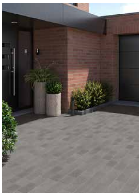
Les pavés multiformats (12x12 / 12x16 / 12x20 cm) Florus carrossables (Ton pierre ou comme ici Anthracite) au prix public indicatif de 42,90 euros HT/m 2