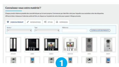
Identifier le matériel (platine ou poste maître)

C'est pro, simple et rapide ! À retrouver ici