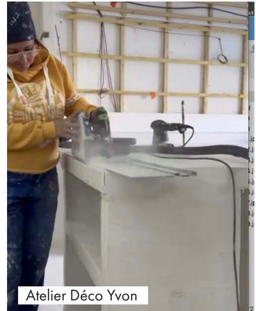
Atelier Déco Yvon