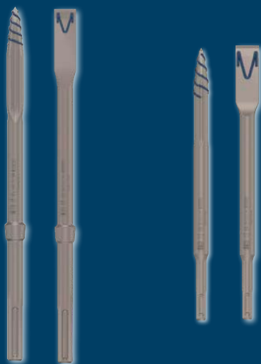
EXPERT SDS max-8C

Pour des performances durables et moins de blocage, les burins pointus et plats EXPERT SDS plus/SDS max-8C sont auto-affûtants. Grâce à leur conception spéciale, ils restent affûtés et tranchants, même lorsqu'ils s'usent, et ce tout au long de leur vie. Leurs nervures de puissance créent des fissures latérales et verticales dans le matériau, garantissant une progression rapide et réduisant les blocages.