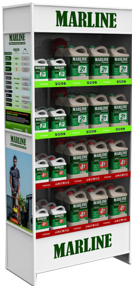
Présentoir sécurité Grand Public