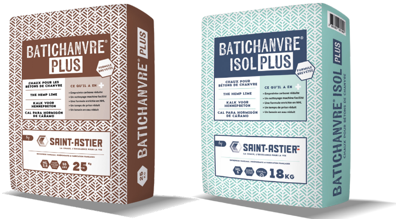
BATICHANVRE® PLUS 25kg - HL5