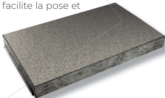
Chaperon pressé à emboîtement Anthracite

Afin de tracer des lignes droites parfaites, chaque extrémité du chaperon plat pressé à emboîtement Fabemi est dotée d'un emboîtement mâle et d'un emboîtement femelle. Cela facilite la pose et l'alignement.