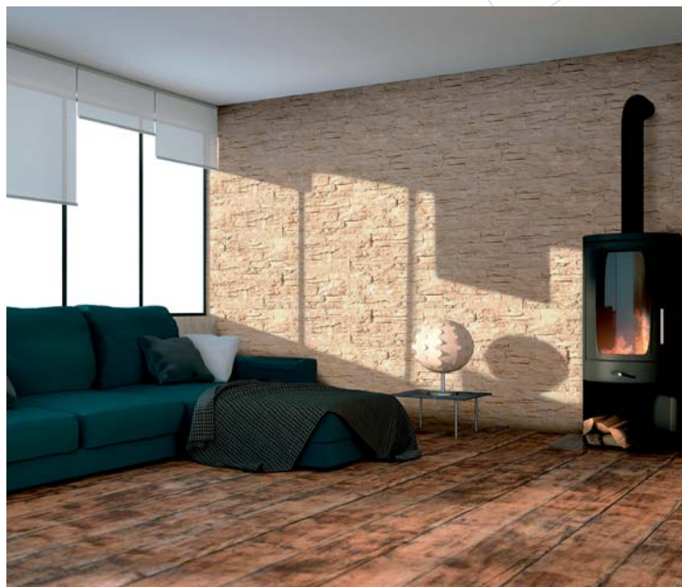
Parement de mur THOLET Aquitaine

Les tout derniers parements de mur en béton THOLET, BOURBILLY et ANSOUIS Fabemi imitent parfaitement divers types de pierres. Ils habillent un mur, protègent et isolent avec une rare élégance. Au service du style de l'espace intérieur ou extérieur, ils sont conçus pour s'assembler facilement et rapidement par emboîtement. Le mélange alternatif des plaques garantit l'esthétique des murs.