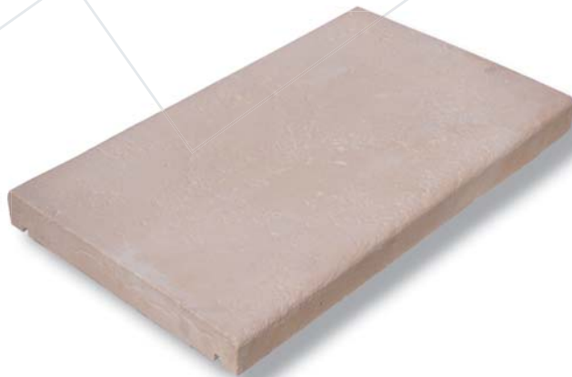
Chaperon vieilli Aquitaine

Les chaperons de murs « pressés » Fabemi suivent le processus de fabrication des pavés : le béton est pressé directement dans un moule puis séché. Ils offrent une finition « béton » brut. Les chaperons lisses et vieillis sont usinés dans des moules - ce qui donne l'aspect final de la surface - puis séchés en étuves et démoulés.