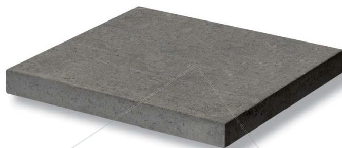
Chapeau de piliers plat Anthracite

Cinq modèles sont disponibles - chapeau plat ou à pointe diamant de 40 cm ou 50 cm de côté (en quatre coloris : Beige, Blanc, Gris et une nouvelle teinte Anthracite), et chapeau pressé (coloris Anthracite, Pierre et Ventoux).