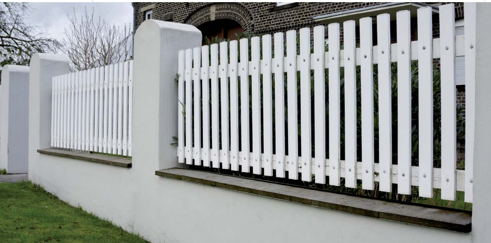
Chaperon à emboîtement Anthracite