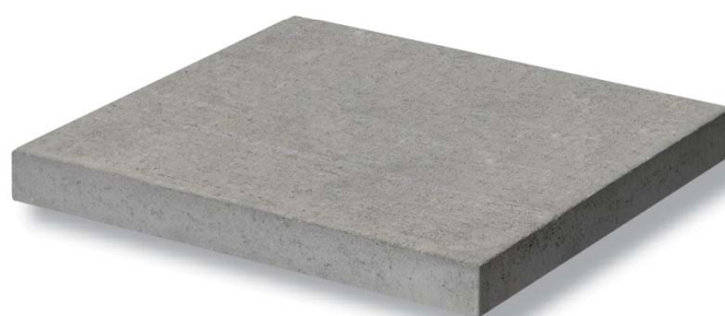
Chapeau de piliers pressé Ventoux