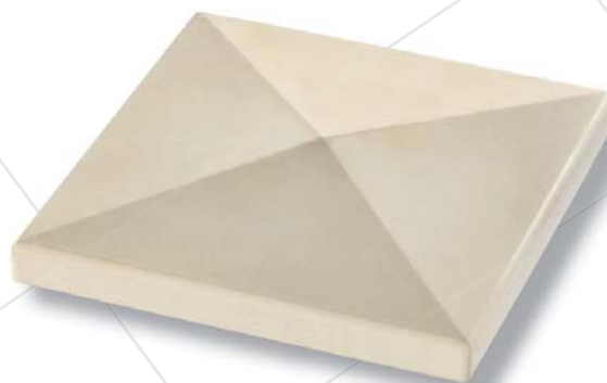
Chapeau de piliers pointe de diamant Beige