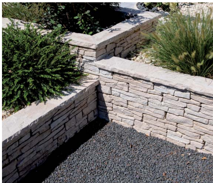
Chaperon Manoir Gironde

La généreuse gamme de dallages, margelles et accessoires Manoir vient de s'enrichir du chaperon Manoir Fabemi. Un accessoire indispensable pour harmoniser les espaces extérieurs et terminer un ouvrage en lui assurant une élégante protection contre la pluie.