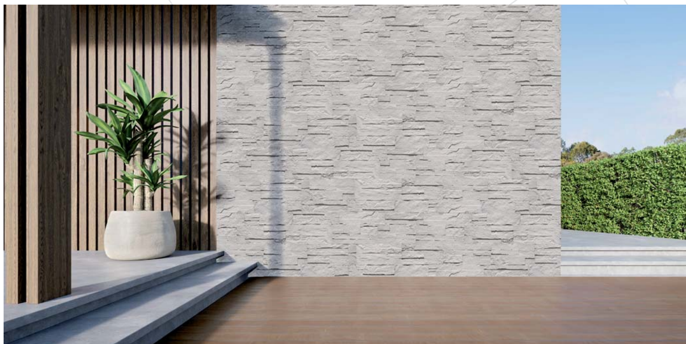
Parement de mur BOURBILLY Ardèche

Cette année, l'offre Fabemi s'enrichit de parements THOLET, BOURBILLY et ANSOUIS, une excellente alternative pour habiller les murs, de chaperons de murs (appelés aussi couvertines), pour des finitions esthétiques et protectrices, et du pavé MAUBEC, prêt à participer à toutes sortes d'aménagements extérieurs. Des produits 100 % Français.