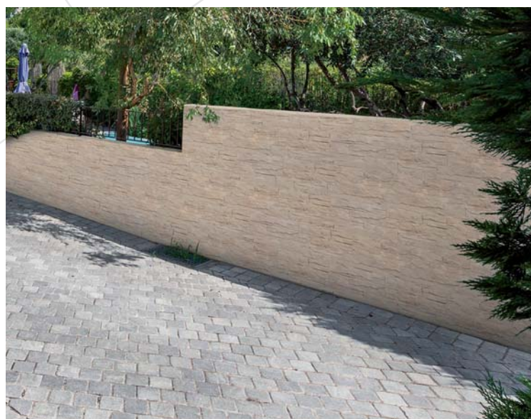
Parement de mur THOLET Aquitaine