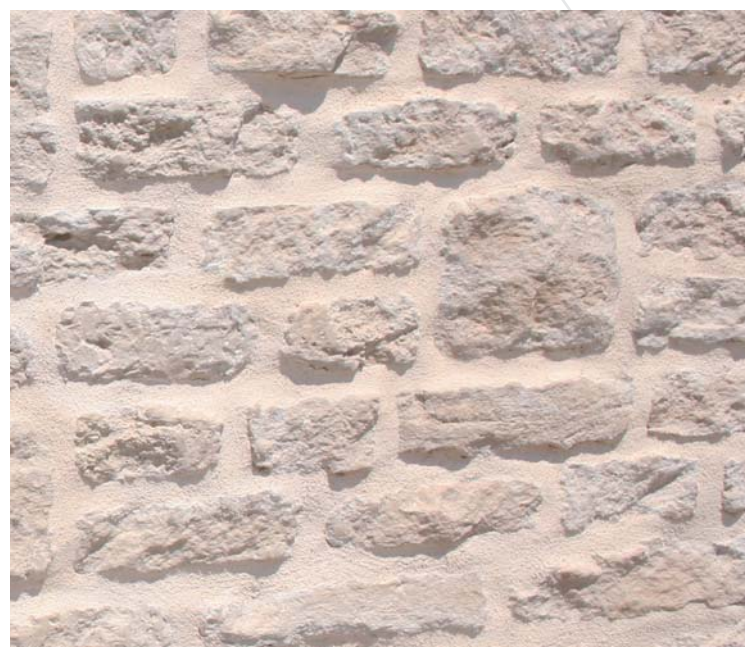
Parement de mur ANSOUIS Aquitaine