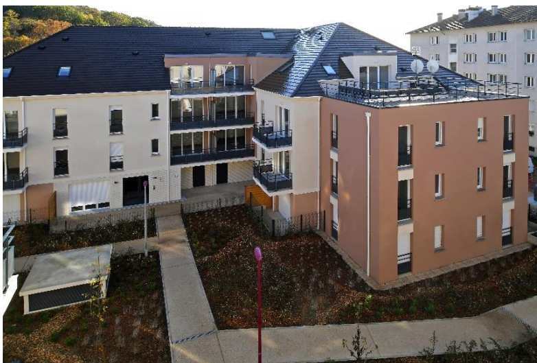
Résidence Clos Compan, Cormeilles-en-Parisis

Fort d'une expertise historique en renouvellement urbain, le groupe 1001 Vies Habitat développe une approche de bailleur-aménageur qui séduit les collectivités locales.