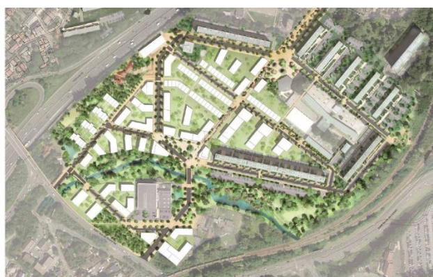
Plan actuel et plan projeté - denerier + martzolf©