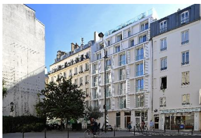
Paris, dans le 17 e arrondissement, la résidence Davy destinée aux jeunes travailleurs.