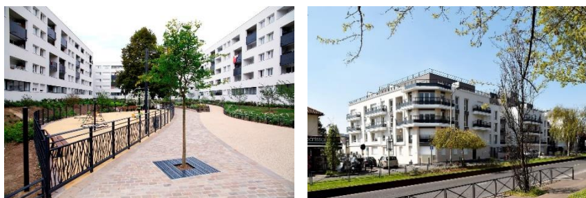
Aulnay-sous-Bois : Les quartiers Nord et La Résidence Les Terrasses des Aulnes

Emblématique par sa taille et la part de logements sociaux très élevée (6 200 logements dont 88 % de logements sociaux), ce quartier a été entièrement restructuré par phases successives. Le projet de rénovation urbaine, d'un montant de 374 millions d'euros, dont 100 millions de subventions publiques et 220 millions d'euros d'investissements de la part de 1001 Vies Habitat, a permis une transformation complète de la trame urbaine et la création d'un nouveau centre intégrant logements, commerces et équipements.