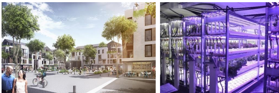
La Résidence des Indes, crédit : UrbanEra. La ferme bioponique de Champerché. Crédit : - 1001 Vies Habitat©

À Sartrouville, 1001 Vies Habitat est engagé dans la reconfiguration du quartier des Indes, en partenariat avec la communauté d'agglomération, la Ville, l'ANRU et Bouygues Immobilier-UrbanEra. Ce programme ambitieux de rénovation urbaine, d'un coût total de 250 millions d'euros et qui doit s'achever en 2030, entend agir sur toutes les dimensions d'un quartier mixte et durable entièrement repensé. Avec près de 1 300 logements sociaux, le patrimoine immobilier sera en partie démoli pour laisser place à un panel de nouveaux logements mixtes : locatif social, accession libre et accession sociale.