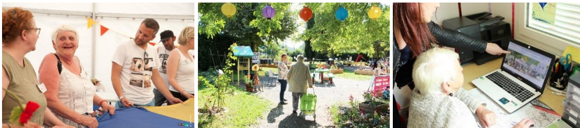
Fête intersites à Aix-les-Bains et accompagnement informatique à Lieusaint

Les habitants décident des projets collectifs qu'ils souhaitent mettre en œuvre : atelier socio-esthétique, renforcement scolaire pour enfants, jardins partagés, ressourceries, clubs de sport, de randonnée, club de bricolage qui prend en charge les petites réparations dans les logements.