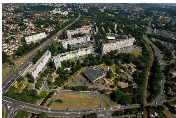
Grand Vaux vue aérienne

d'une opération à maîtrise foncière partielle : 1001 Vies Habitat commercialisera en propre les terrains libérés par la démolition des barres et des tours, en échange d'une participation financière à l'opération d'aménagement.