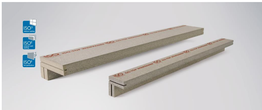
Image 4 : Protection contre l'incendie avec ISO-TOP WINFRAMER „TYPE 1“ E30