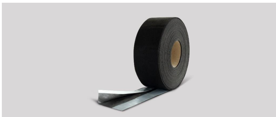
Image 5 : Montage flexible avec film de raccordement de fenêtre ISO-CONNECT VARIOFLEX SD+