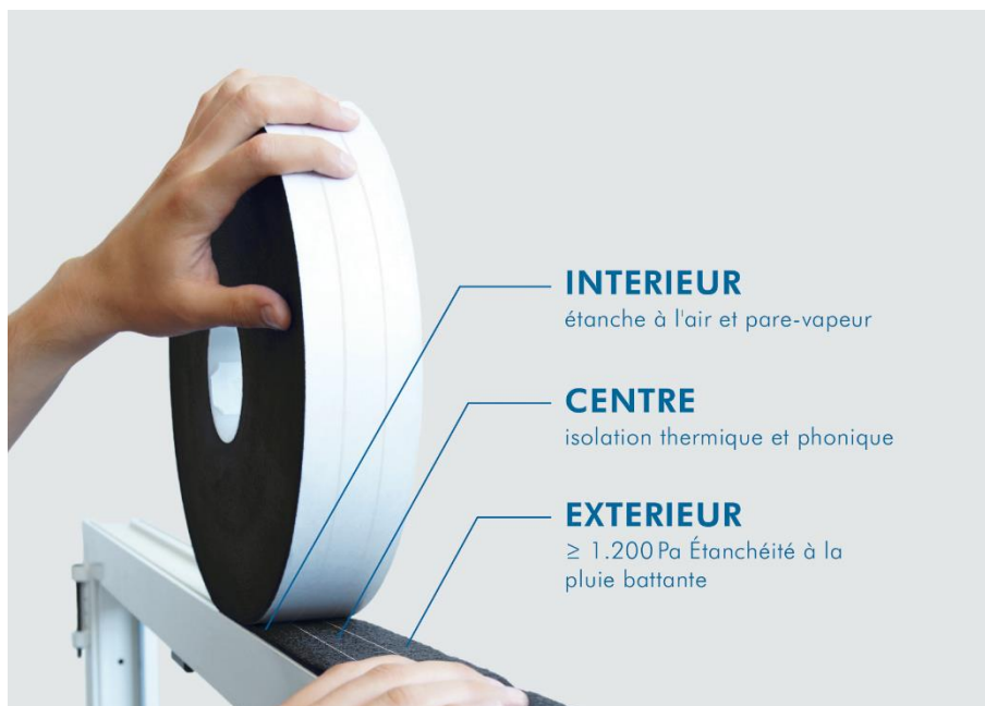
Image 2 : Technologie hybride dans la bande multifonctionnelle ISO-BLOCO HYBRATEC