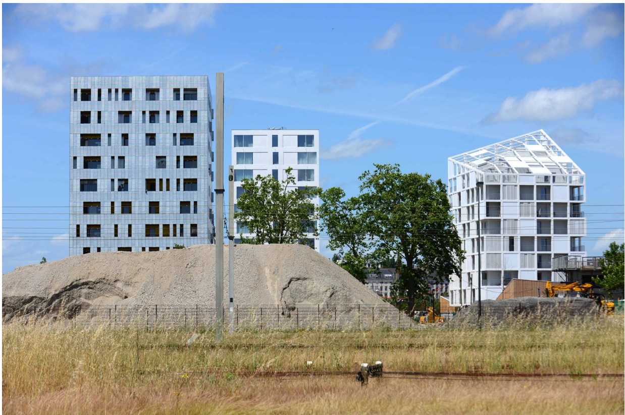
Le quartier Prairie-au-duc vu depuis l'ancien réseau SNCF, site des futurs Jardins de l'Estuaire, à l'ouest de l'île de Nantes

Ces déblais (terres, sables, granulats, matériaux de type béton concassés ...) seront ensuite réemployés à l'échelle de l'île pour différentes fonctions : sous couche de voirie, nivellement d'espace public, création de nouveaux espaces verts.