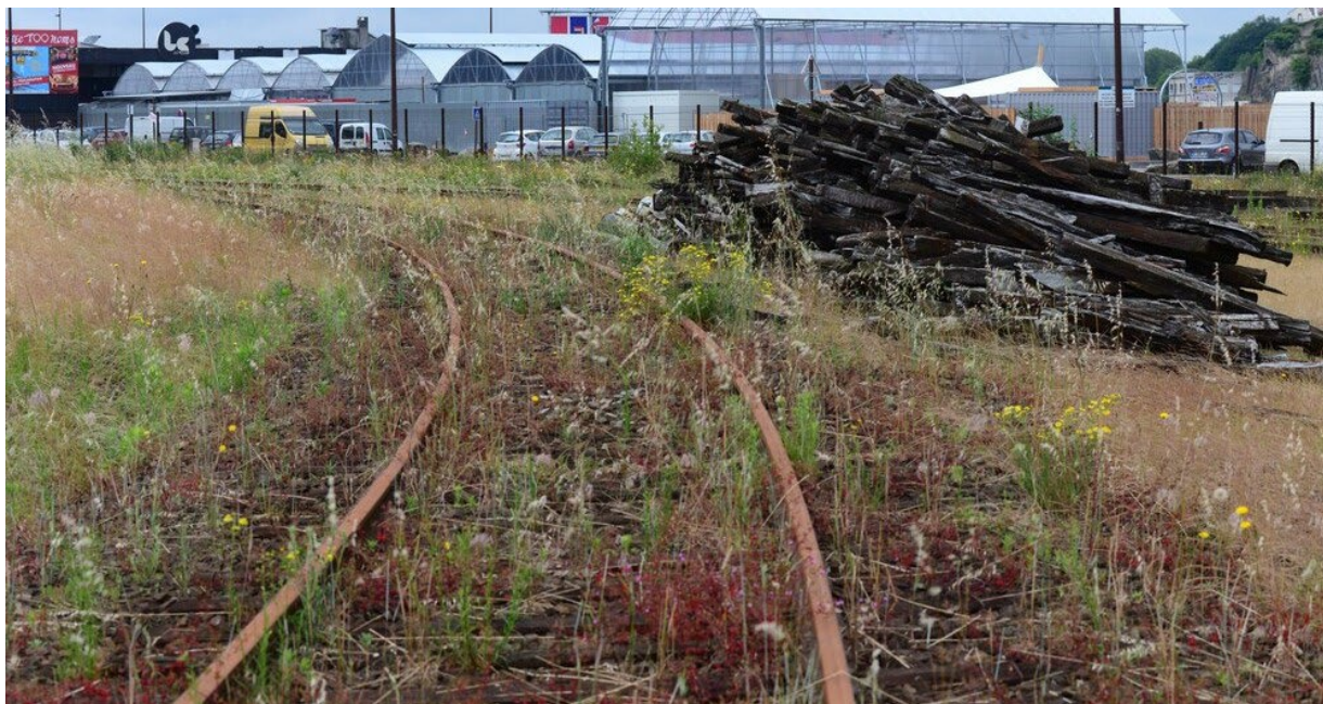
La nature reprend ses droits sur l'ancien réseau SNCF, site des futurs Jardins de l'Estuaire, à l'ouest de l'île de Nantes

Aux étapes successives du projet urbain, la Samoa et les urbanistes de l'île de Nantes ont constamment proposé des démarches durables et vertueuses de gestion et de conception. Aujourd'hui, alors que le nouveau quartier République se construit au sud-ouest de l'île de Nantes, en parallèle du chantier du Nouvel Hôpital du CHU, et que la métropole nantaise réaffirme son ambition de transition écologique, la Samoa s'engage pour limiter encore davantage l'empreinte écologique du projet urbain.