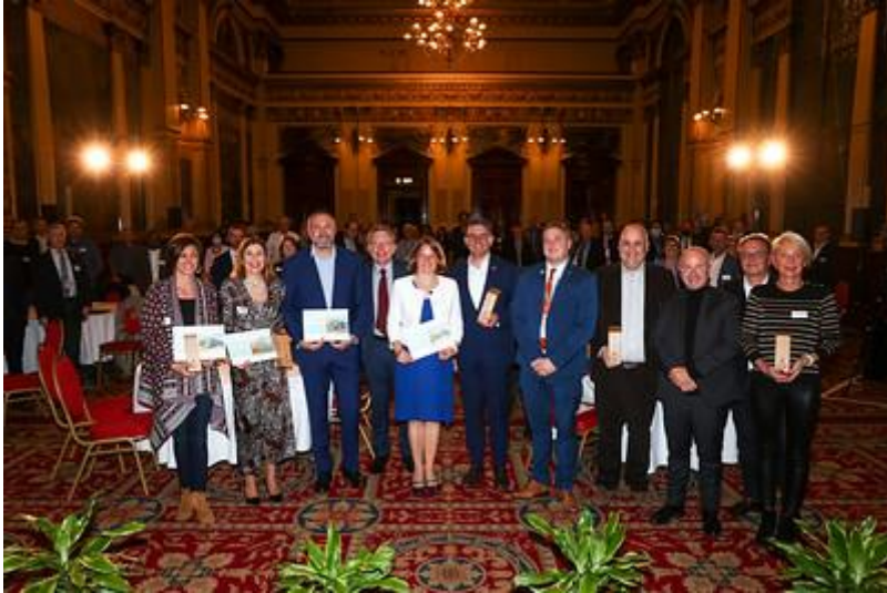
Les lauréats internationaux à la remise des prix à Glasgow en présence de Barbara Pompili, alors ministre de la Transition écologique