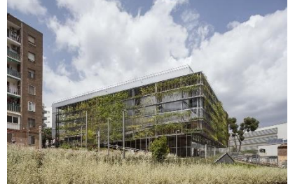
Turo de la Peira – ©Enric Duch