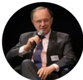
PATRICK DE CAMBOURG AUTORITÉ DES NORMES COMPTABLES (ANC)