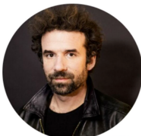
CYRIL DION ÉCRIVAIN, RÉALISATEUR