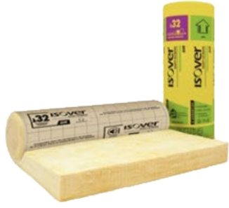
Laine de verre

ISOVER encourage la rénovation énergétique et la construction de bâtiments neufs en déployant un arsenal de matériaux d'isolation comprenant la laine de verre, laine de roche, fibre de bois et laine de coton, qui répondent aux exigences thermiques avec un confort d'été et d'hiver, améliorent l'acoustique, permettent des diminutions effectives de la consommation de chauffage et de climatisation.