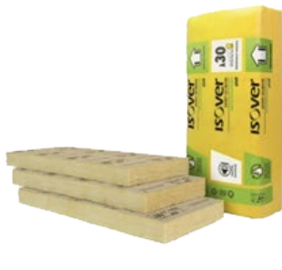
Laine de roche