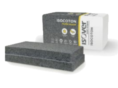
Laine de coton