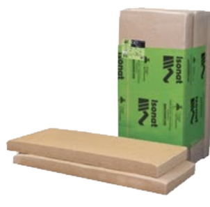
Fibre de bois