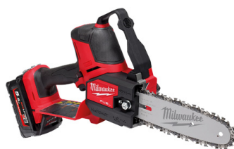
Élagueuse HATCHET® 20 cm M18 FUEL™ - M18 FHS20