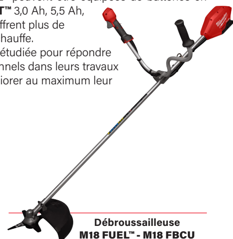
Débroussailleuse M18 FUEL™ - M18 FBCU