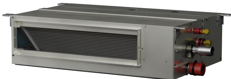
Photo presse Bosch 03 : Le nouveau gainable airHome Ducted Slim avec seulement 19 cm 3 d'hauteur.