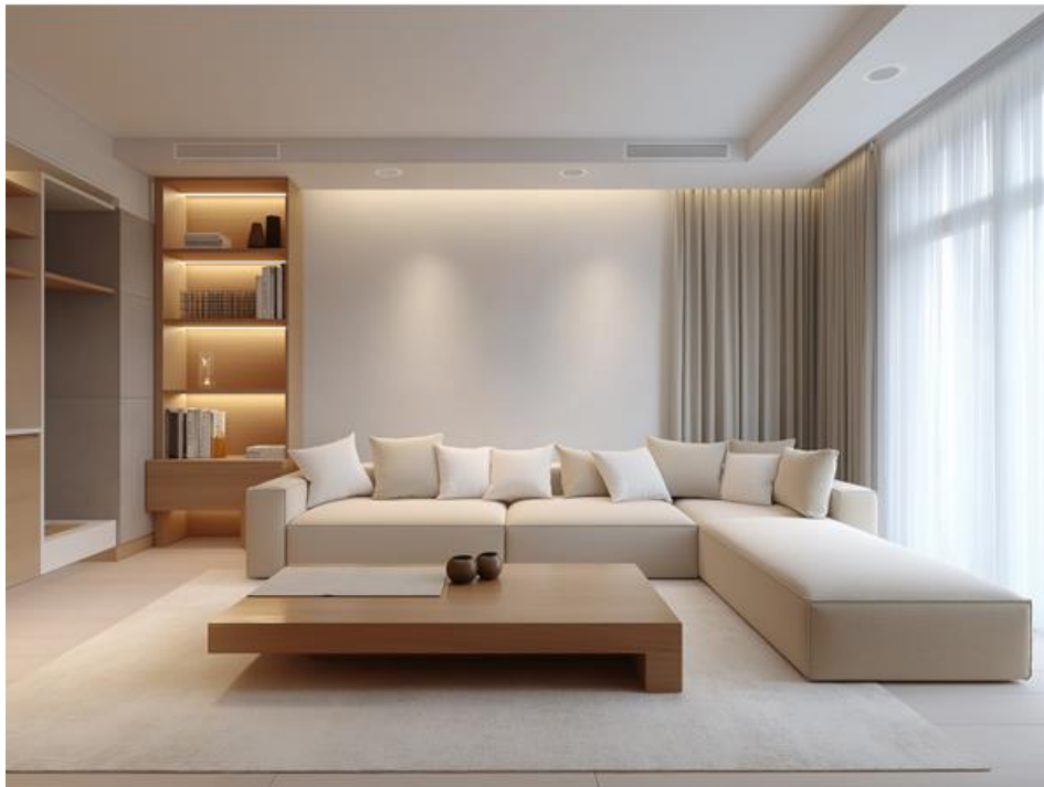
Photo presse Bosch 01 : Le nouveau gainable airHome Ducted Slim installé dans un salon.